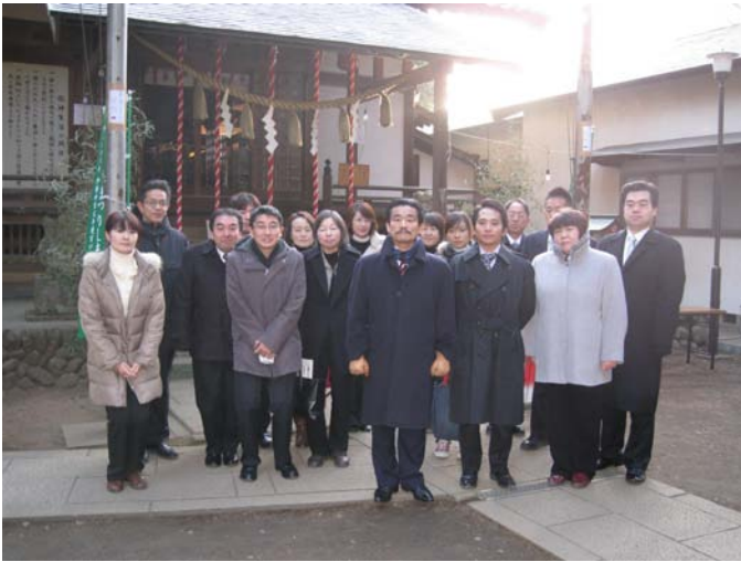
1月4日、尾崎神社へ初詣に参拝。

発行日：平成22年1月 発行者：医療法人 高友会 笠幡病院 住所：〒350-1175 埼玉県川越市笠幡 4955-1 TEL：049-232-1231(代表) 049-232-1235(歯科直通) ホームページ：http://www.kasahata-hospital.or.jp/