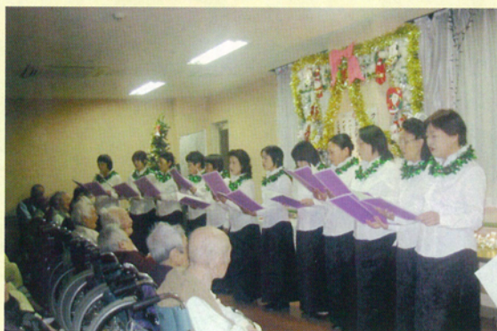
コーラス (さくらんぼ)