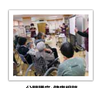
公開講座・健康相談