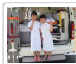
救急車展示・なりきりコーナー