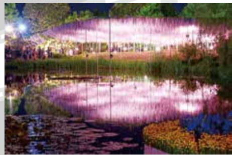
足利フラワーパーク：池に反射した藤