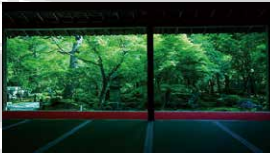
圓光寺：初夏の青もみじ