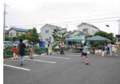
バルンアートと皿回し