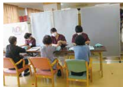
ハンドマッサージ