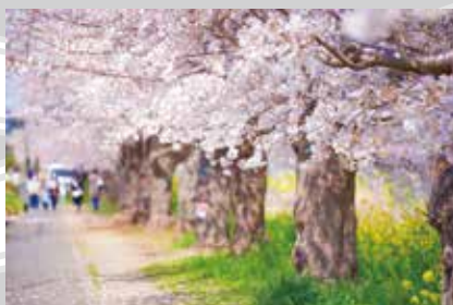
久喜市青毛堀の桜